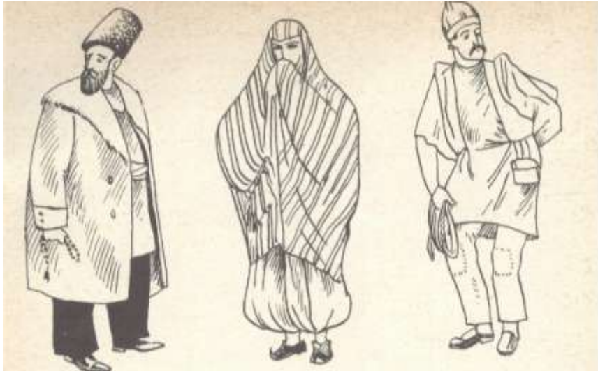
Bakının köhnə tiplərindən